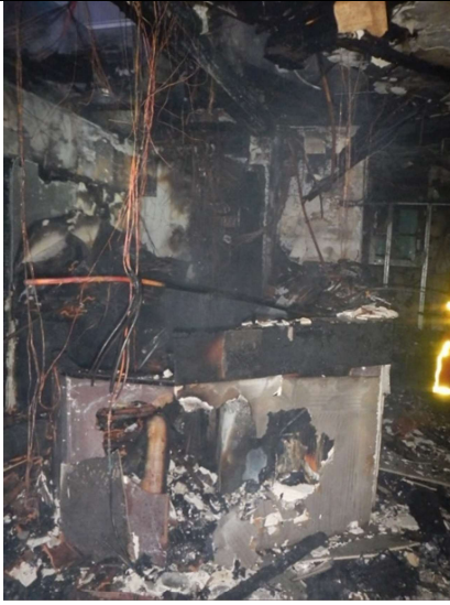
Vue depuis l'emplacement du chef d'équipe